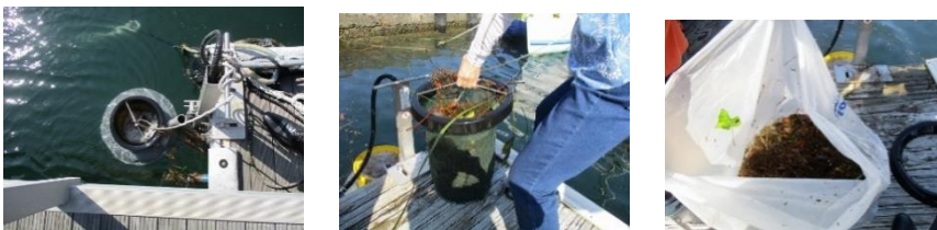
シービンでゴミを回収する様子