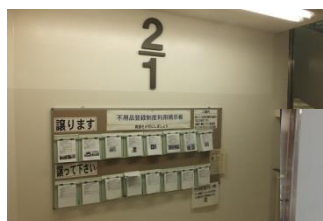
イトーヨーカドー大船店 1階~2階への踊り場