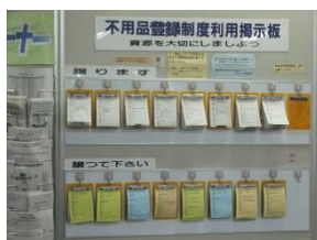
鎌倉市役所ロビー