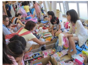
「誰かの役に立ってね」