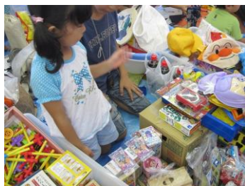
「この値段で売れるかな?」