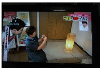
リユースネットに登録する様子

今年7月にはNHKの「あさイチ」でも紹介されました。ほしい方に譲る、譲ってもらう、という「リユース」の気持ちはステキなこと!あなたもいかがですか?