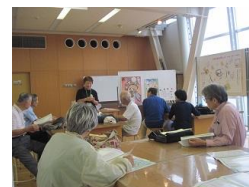
ごみの出し方を確認