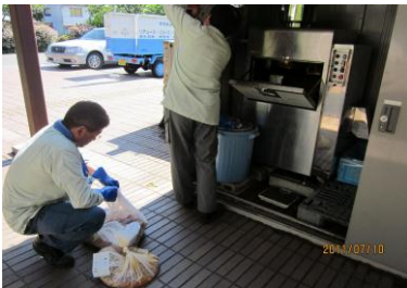
市役所本庁舎に置いてある生ごみ処理機。御成小学校の残菜がここに入ります。

小学校でも給食の調理くずや残菜を処理機で処理して、堆肥として利用するリサイクルをしています。