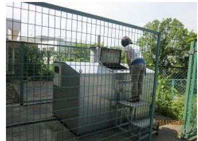
富士塚小学校にある生ごみ処理機 富士塚小と腰越小の残菜を処理しています。

小学校でも給食の調理くずや残菜を処理機で処理して、堆肥として利用するリサイクルをしています。