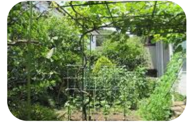
お庭は肥沃な土のおかげでなす、きゅうり、トマト、ゴーヤ、ぶどうなどがたわわに。