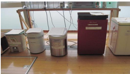
各種の生ごみ処理機を展示しています。使用方法等の質問にお答えします。

鎌倉リサイクル推進会議では家庭用生ごみ処理機を展示し、稼働させています。見学は自由にできますので、ぜひご来館ください。鎌倉市では、生ごみ処理機を購入すると購入費の75%~90%(上限40000円)を助成する制度があります。詳しくは市役所環境部資源循環課(61-3396)にお問い合わせください。