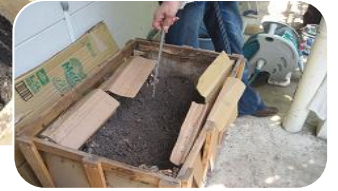
段ボールで作った堆肥。温度は50度にもなります。